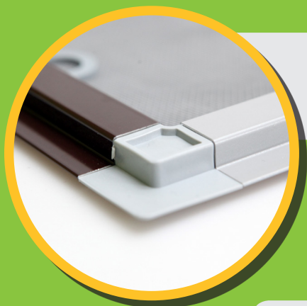
Fliegengitter für Fenster